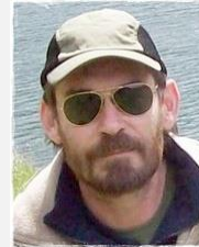
A túrát szervezte: Torma László